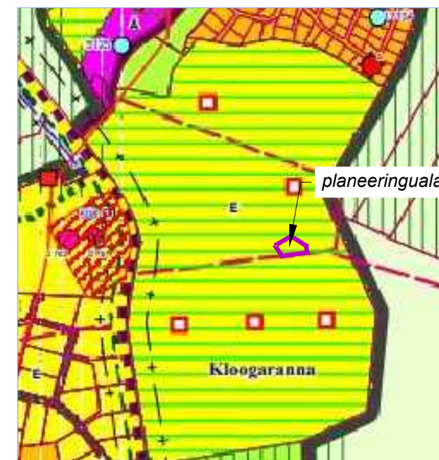
Väljavõte Keila valla üldplaneeringust. Kehtestatud Keila Vallavolikogu 13.10.2005 otsusega nr 259/1005. Alates 24.10.2017 Lääne-Harju vald