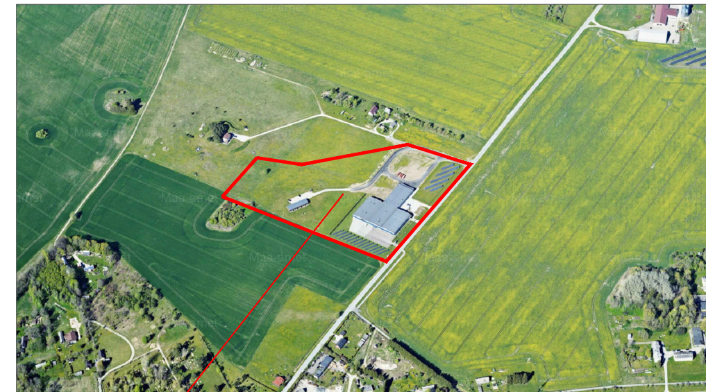
EKOI, RISTIKU JA VÄIKE-RISTIKU KATASTRIRÜKSUSTE NING LÄHIALA DETAILPLANEERINGU ALA